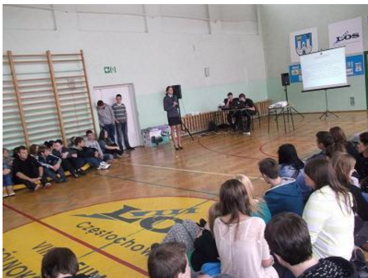
(spotkanie z młodzieżą)