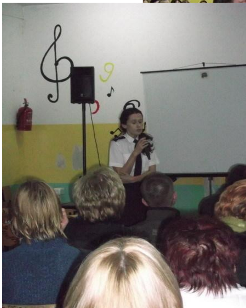
(spotkanie z rodzicami)